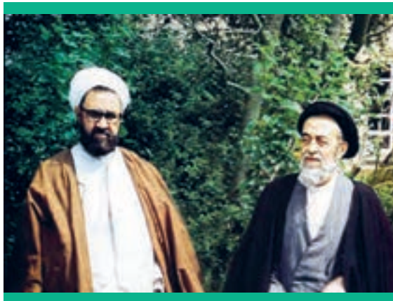
علامهٔ طباطبایی و استاد شهید مطهری

آن بزرگوار از زمانی که قلم به دست گرفت، آثاری پربار و ماندگار از خود به یادگار نهاد. هدف اصلی او پاسخ‌گویی به پرسش‌هایی بود که در عصر حاضر برای جامعهٔ ما مطرح است. برای مثال، شرح ایشان بر کتاب اصول فلسفه و روش رئالیسم علامهٔ طباطبایی نه تنها در دهه‌های اخیر در دفع شبهات دینی و فلسفی مادیون نقشی تعیین کننده داشته، بلکه راه را برای مباحث تطبیقی با فلسفه‌های دیگر نیز هموار کرده است. دیگر آثار فلسفی استاد شهید مانند شرح منظومه (مختصر و مبسوط)، شرح الهیات شفا، شرح اسفار، شرح اشارات، علل گرایش به مادیگری و ... در معرفی حکمت اسلامی به نسل جوان و متفکر سهمی بسزا داشته است. شاگردان و دست‌پروردگان ایشان امروز از سکان‌داران فرهنگ اسلامی در جامعهٔ ما هستند.