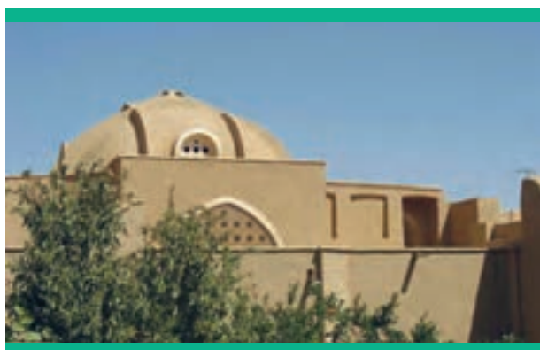
منزل ملاصدرا در کهک قم

حقیقت این است که زمانه مرا به جماعتی کودن مبتلا کرده است که دیدگان آنها از رؤیت انوار دانش و فهم اسرار آن نایبناست و همچون شب پرکان از مشاهده معارف و تعمق در آنها عاجز و ناتوان است؛ اینان تدبّر در آیات سبحانی و تعمق در حقایق ربانی را بدعت می‌شمارند. اینان مردم را با مخالفت و عناد خود از حکمت و عرفان محروم کرده‌اند و آنها را به کلی از راه علم و اعتماد به علوم مقدسه الهی و اسرار شریف ربانی که انبیا و اولیا به کنایه گفته‌اند و حکیمان و عارفان به آن اشارت فرموده‌اند، دور می‌کنند.