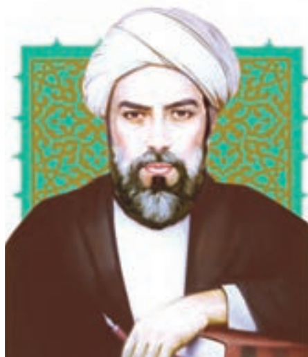
صدر المتألهين شيرازی