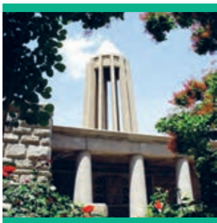
آرامگاه ابن سینا در همدان

می‌کرد که دیگر یارای مقابله با بیماری را ندارد؛ لذا از ادامهٔ درمان دست کشید و گفت: «نَفْسِی که تدبیر بدن من به عهدهٔ اوست، از تدبیر عاجز شده و دیگر درمان سودی ندارد».