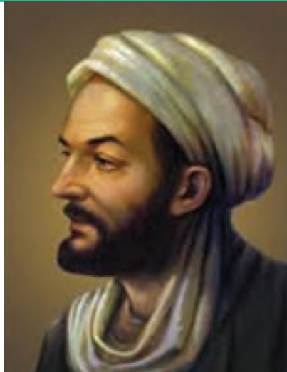
شیخ الرئیس ابوعلی سینا